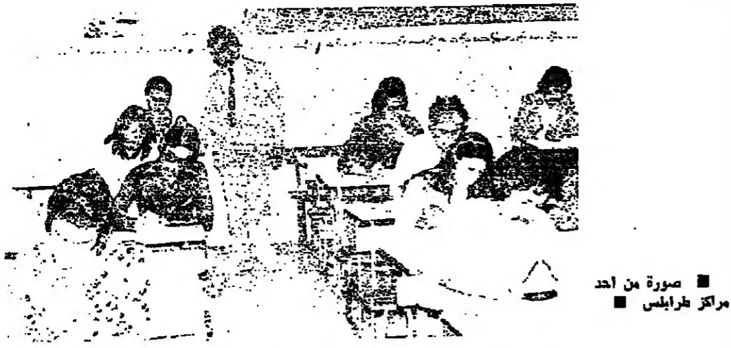
صورة من احد مراكز طرابلس